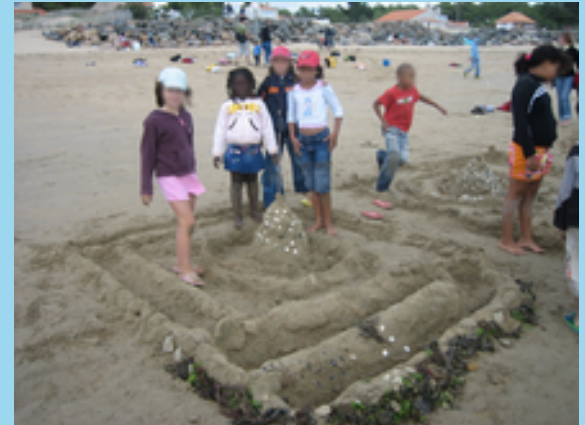
Pêche à pieds