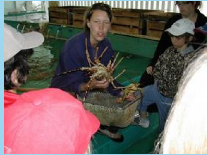
Port Bourgenay de Talmont St hilaire.