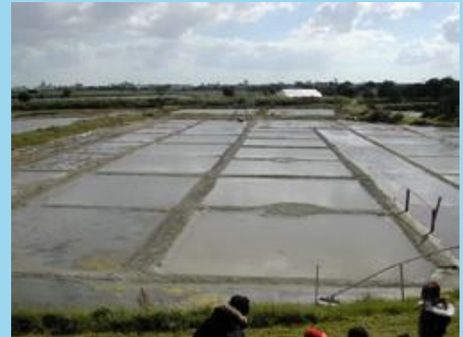
Marais de la GUITTIERE à Talmont St hilaire