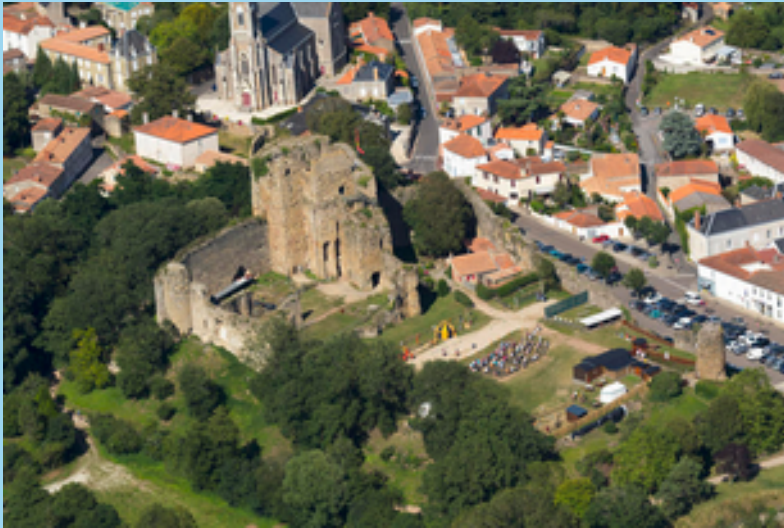
Château de Talmont St Hilaire