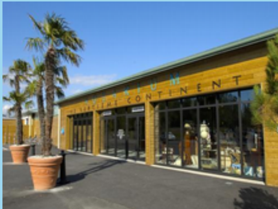
L'aquarium le 7ème continent